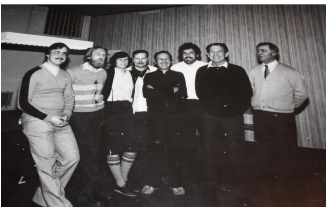
1 er comité du club (1984) regroupant tous les membres fondateurs