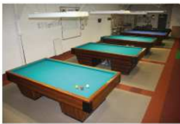
Les locaux du FCM Billard et ses 5 billards

"Le Billard ... Français, c'est quoi ?" C'est une distraction pour les uns, un sport, de surcroit de compétition, pour les autres. Et ce "passe-temps" occasionnel peut rapidement se muer en passion. Si le billard se développa fortement sous Louis XIV qui le mit à la mode (comme on dit aujourd'hui), il ne revêtit son habit actuel et n'adopta les règles en vigueur qu'au 19ème siècle. Il connut son apogée entre 1850 et 1950. A cette époque, tous les hommes faisaient du "Français"... au café du commerce, bien entendu. Aujourd'hui, mondialisation oblige, il est quelque peu oublié. Mais il fait et fera toujours partie de notre mémoire. Et pourquoi ne pas parler "d'exception française", de culture française ? Ringardisé par les uns, parce que faisant (trop) sérieux, préférant les billards à trous, il restera toujours un mode d'expression artistique intelligent. Car il faut réfléchir, se concentrer et s'entraîner pour jouer au Français. Et là, avec patience, peut-être... Qui sommes-nous ? Une bande de joyeux pour les uns, de gaulois pour d'autres, qui n'a de prétention que de s'amuser, toujours... Venez nous rejoindre, vous ne le regretterez pas ! Jeunes et moins jeunes, hommes et femmes - car celles qui s'y sont mises y ont pris goût -, Vous serez les bienvenus !