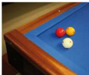
Le Billard Français, c'est trois billes et ... pas de poches dans les coins ...